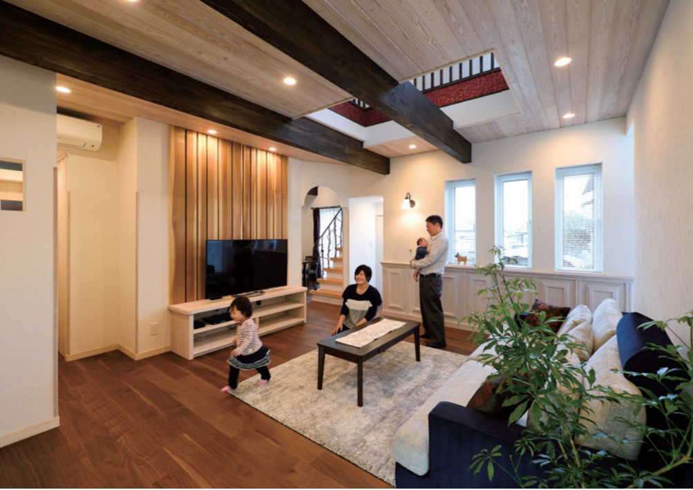
TVの後方で存在感を発揮するのは、赤と白の色味がはっきりと浮き出た秋田杉。大木のような優しさと重厚感をイメージしているほか、窓際には洋風の腰壁をあしらうなど、異なる文化を巧みに融合したセンスに思わず目を見張る方も多いのでは。