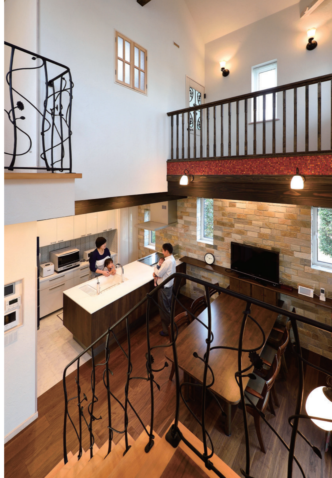
ダイニングキッチンがアールを描いた天井までの高さが約8mという開放感が大きな特長。さらにラグジュアリー感たっぷりの天然石をはじめ、花や蔓をイメージしたオリジナルデザインが印象的なアイアンの手摺に米松の見せ梁など、素材の一つひとつに強いこだわりを窺わせる。(この見開き頁の写真はO氏邸)