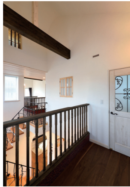
吹き抜けは2か所。そのため、1階からロフトまで全ての空間が緩やかに繋がっているかのように感じられる。