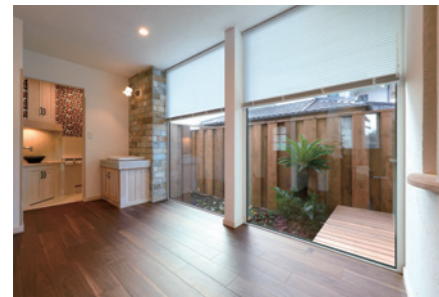
帰宅時にすぐ手の汚れが落とせるようにと、玄関にはオーダーの洗面台を設置。トイレのカラフルな壁紙も目を引く。