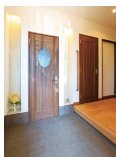
玄関上がり口のしゃれたドアの向こうに、広い土間収納やシューズクローゼがある

音楽の教師をしているご夫妻は、2階に設置したグランドピアノを時折弾いているが、高气密・高断熱のおかげで、大きな音が外に漏れることはないという。働きながら快適な環境で子育てできることに、ご夫妻は改めて感謝している。