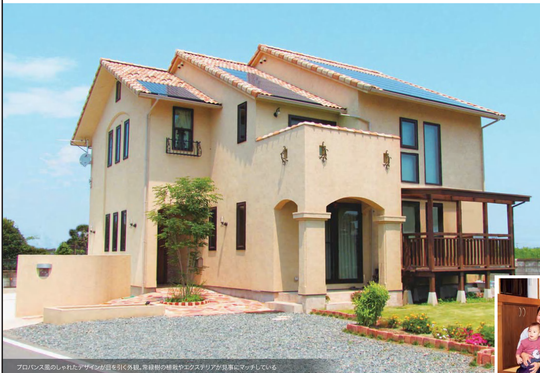
プロバンス風のしゃれたデザインが目を引く外観。常緑樹の植栽やエクステリアが見事にマッチしている