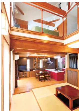
間仕切りがなく広々としたLDK。小上がりの畳敷きリビング(手前)の上は吹き抜けで、空気の循環がしやすい構造になっている

外観はご主人の好みだというプロバンス風のデザイン。明るいオレンジ色の外壁や瓦屋根が青空に美しく映える。玄関前に植栽された常緑樹のシマトネリコが、建物と見事に調和している。