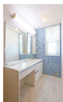
ドレッサーを兼ねた洗面台。メイク室のような上品な雰囲気漂う

屋根に5.8kWの太陽光発電システムを搭載しており、年間の売電量は消費電力量を上回り、差し引き8万3000円の黒字で、家計の手助けとなっているそうだ。