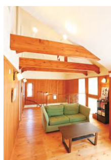
吹き抜けて天井が高く、明るい開放感のある2階のセカンドリビング。ご夫妻のくつろぎの場や子どもたちの遊び場になっている

室内で愛犬を飼っているのに、特有の動物臭がまったくなく、爽やかさの秘密は、ファースの家独自の「健康空気循環システム」によるものだという。換気と温度調節、空気洗浄を24時間行いながら、新鮮で爽やかな空気を家中に循環させる仕組み。床下には特殊なシリカゲル「ファースシリカ」が敷き詰められており、湿度の調節もしてくれる。無垢の木や珪藻土などの自然素材と相性がいいのも特徴だ。