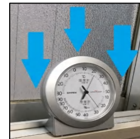
（著：東京事務所 藤原智人）